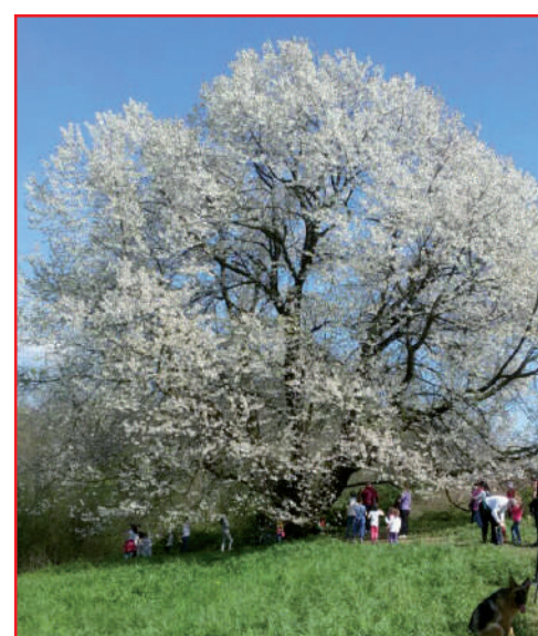
Percorso 21 km passaggio al ciliegio centenario

Partenza presso il Centro Sportivo ROSSINI in via Magellano a Brioso